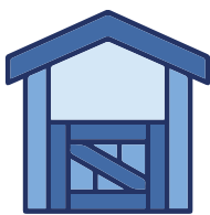
Location de box sur paille 30€ (2 nuits) 10€/nuit supplémentaire