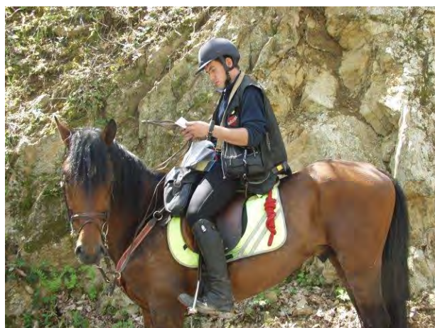
Lecture de la carte sur le POR