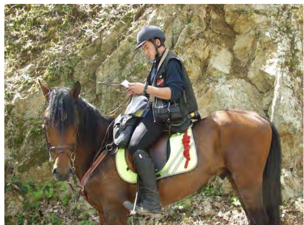
Lesen der Karte auf dem POR