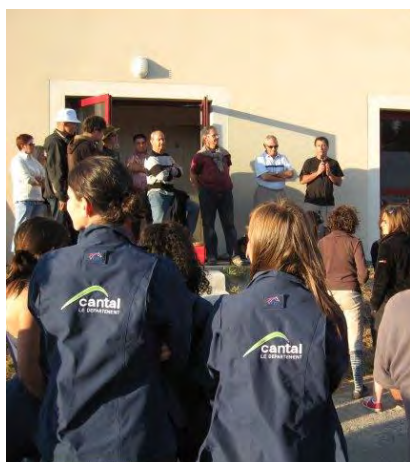
Einweisung in die Wettbewerber